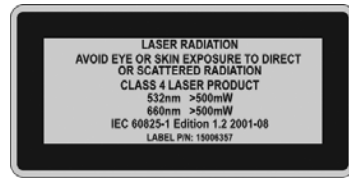
그림 1 4등급 레이저 경고