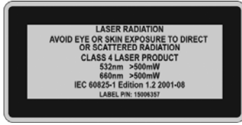
Figura 1 Advertencia de láser de Clase 4