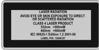
Figura 1 Avvertenza per il laser di Classe 4