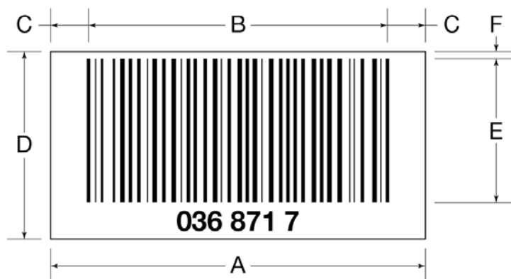
Figura 2 Dimensões do código de barras